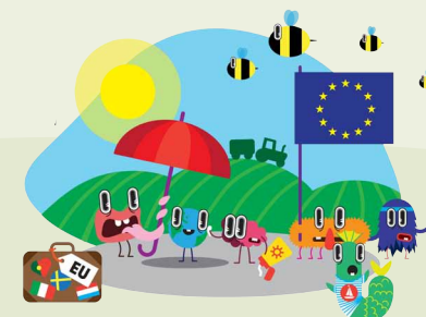
EUROPAWAHL: 9. JUNI 2024

In diesem Jahresprogramm findest Du Hinweise und Termine zu unseren Veranstaltungen. Misch Dich ein, lass Dir den Schnabel nicht verbieten, setze Dich gegen Hass und Krieg zur Wehr und hilf mit, eine lebenswerte, gerechte und nachhaltige Zukunft für alle Menschen zu gestalten.