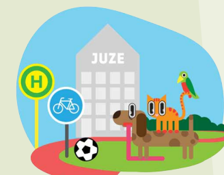
KOMMUNALWAHLEN: 09. JUNI 2024