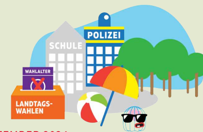
LANDTAGSWAHL: 22. SEPTEMBER 2024